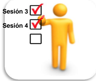
Actividades y decisiones tomadas en la Sesión 3 y lo que se hará en la Sesión 4