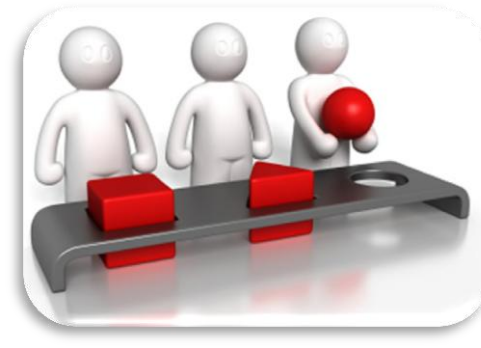
Identificación y análisis de "Activos" Familiares de acuerdo con el reporte de Sistema de Información