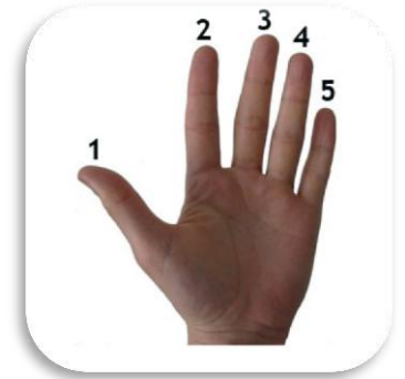
Definición de compromisos de la familia con base en los 5 Logros Básicos seleccionados.